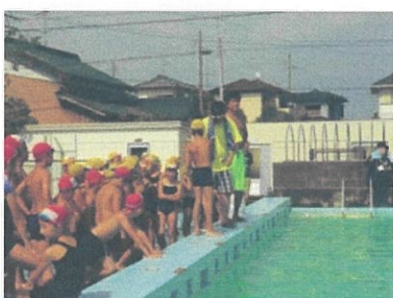
防災キャンプin取小