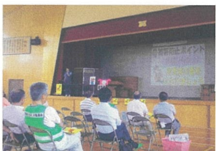
オレオレ詐欺講習会