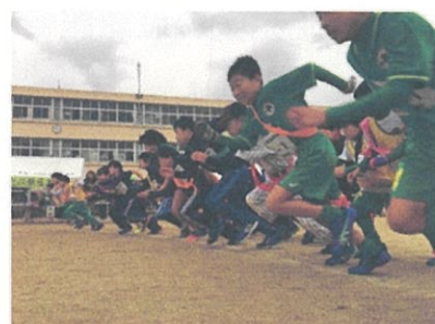
大家族ひえだ川駅伝