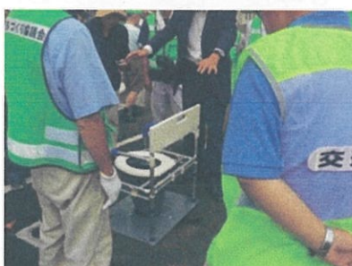
体験型防災訓練(どんぐり公園)