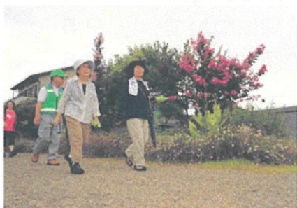
彼岸花観賞ウォーキング